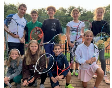
U15 gemischt im Sommer 2022

Eine U18 Juniorenmannschaft war in der Winterrunde gemeldet, die allerdings dieses Jahr nur Erfahrung sammeln konnte. Dieses Jahr konnte man wetterbedingt erst Mitte Mai auf die Plätze auf dem Wagnershof, so dass die Vorbereitungszeit für die Freiluftsaison ziemlich knapp war, zumal die Trainingszeiten nur samstags- und donnerstagsabends waren. Am Training hingegen nahmen bis zu 36 Kinder und Jugendliche teil.