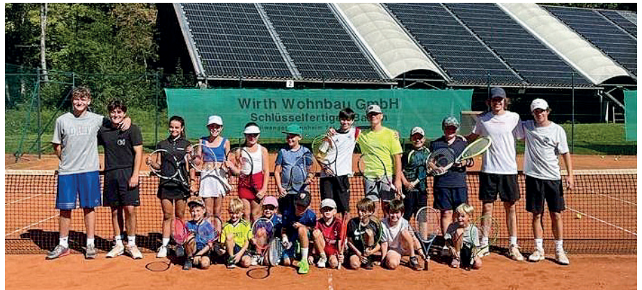
Trainer und Teilnehmer der Tenniscamps

Wie in den vergangenen Jahren wurde das Training ab Mitte September wieder in die Halle verlegt. Neu hinzu gekommen war eine U18 Juniorinnen Mannschaft. Die Spielrunde im Sommer startete erst Mitte Juni. Im Unterschied zum Vorjahr entfiel aus altergründen die U12 KidsCup Mannschaft, so dass 3 Mannschaften U18 und 2 Mannschaften U15 jeweils männl. und weibl. gemeldet werden konnten. Da einige Mannschaften im Vorjahr aufgestiegen waren, war die Spielstärke der gegnerischen Mannschaften natürlich entsprechend stark. Die „Personaldecke“ war aus verschiedenen Gründen teilweise sehr knapp, so dass an manchen Spielen leider nur 3 Spieler/Innen teilnehmen konnten. Dies zeigte sich dann natürlich auch in der Tabelle.